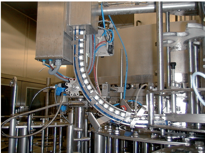
UVATEC bei der Verschlussentkeimung in der Getränkeindustrie