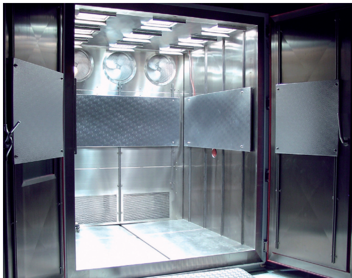
Klimakammer mit 9 SOL 2000 Geräten

Die Strahlung aller SOL-Geräte wird von Gasentladungslampen erzeugt, welche Metallhalogenide enthalten. Diese Strahlungsquellen emittieren ein nahezu kontinuierliches Spektrum , welches gut an das der natürlichen Sonnenstrahlung angepasst ist. SOL-Geräte erzeugen kein Ozon.