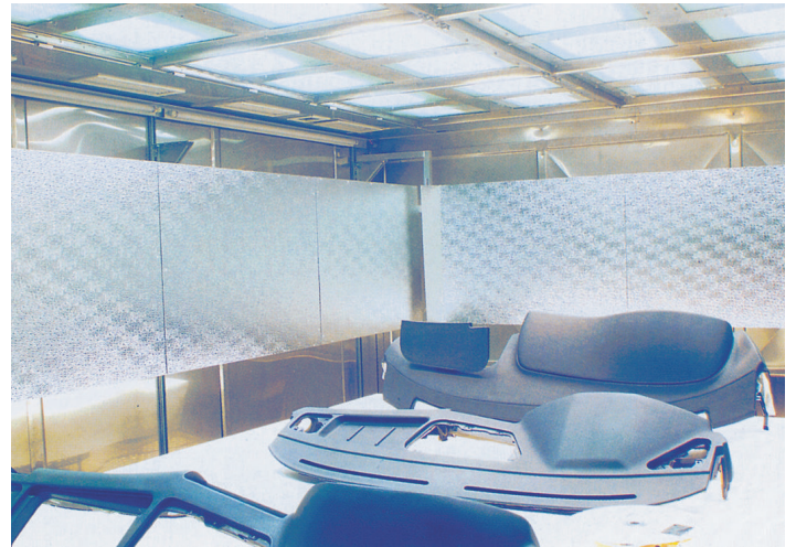
Klimakammer mit 24 SOL 1200 Geräten

Neben herkömmlichen Drossel-Vorschaltgeräten können ebenfalls Vorschaltgeräte aus Hönle-Produktion eingesetzt werden. Das elektronische Vorschaltgerät versorgt die Lampe mit einem rechteckförmigen Strom. Dadurch verbessert sich das Verhalten des erzeugten Lichtstroms und die Lichtleistung wird um ca. 10% gesteigert.