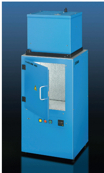
Sonnenlichtsimulationskammer UVACUBE 400

UVACUBE 400 ist eine kom- pakte Sonnenlichtsimulati- onskammer . Der SOL-Strahler erzeugt eine Intensität, welche dem 7-fachen des natürlichen Sonnenlichts entspricht. Die Strahlung ver- teilt sich gleichmäßig über die Bestrahlungsfläche von max. 40 x 30 cm ; damit eig- net sich der UVACUBE 400 ideal für Materialalterungs- versuche.